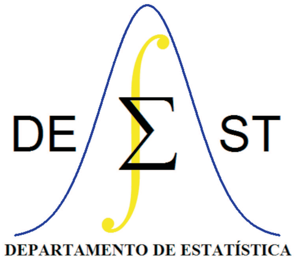
Figura 1: Teste de uma figura em formato .eps