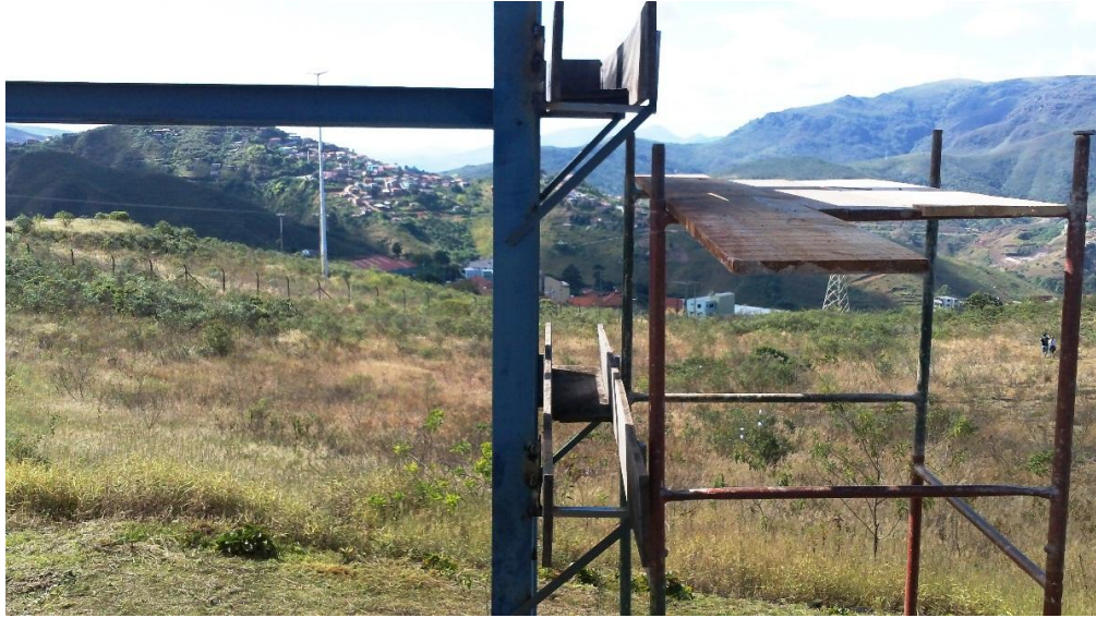
Vista lateral do modelo de passagem de minério, instalado ao lado do LTMM-DEMIN.