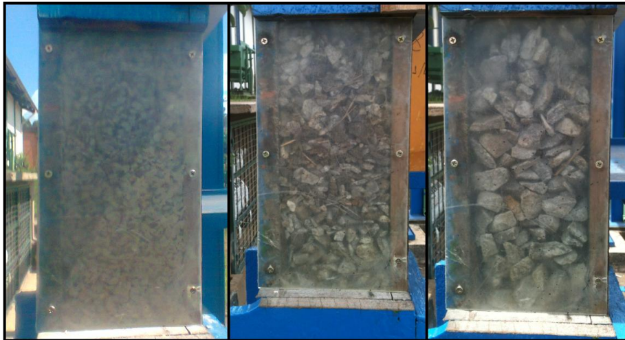
Fotos de material fragmentado dentro do modelos em ensaios de descarga e bloqueios. (*)